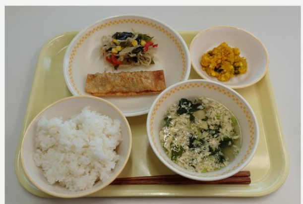
第2位「黄色の食器（汁椀と平皿がチェック柄） ・黄色のトレー」