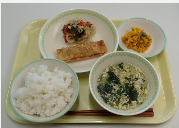
第1位「緑色の食器（汁椀と平皿がチェック柄） ・黄色のトレー」